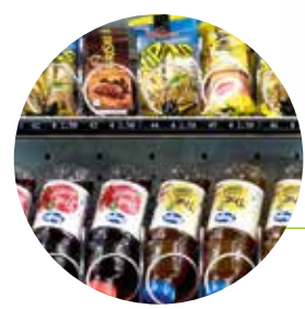
Vitrine à haute définition