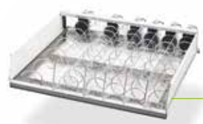
Plateau Visioshop, transparent, flexible et renforcé