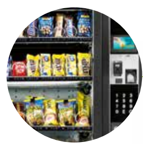
Un distributeur élégant et raffiné