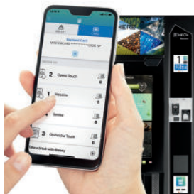
Maestro Touch est compatible avec l'appli de sélection et de paiement digital Breasy