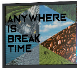
Design moderne et attractif