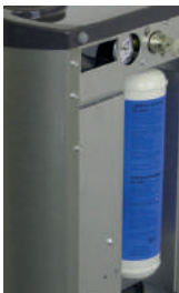
Réglage du mélange de CO 2 / eau pour une eau pétillante à très gazeuse

Adjusting the CO 2 / water mix for a carbonated to a very sparkling water