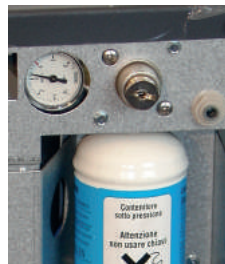
Manomètre intégré pour contrôler la pression du CO 2 .

Adjusting the CO 2 / water mix for a carbonated to a very sparkling water