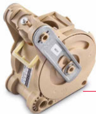
Un système breveté pour un café parfait