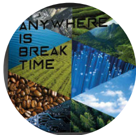
Un design moderne et attractif